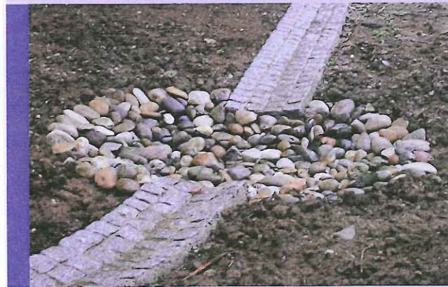
Beispiel für eine Versickerungsanlage

Der Leitfaden zur Oberflächenentwässerung 2.0 bietet umfassende Lösungsansätze zur fachgerechten Verbringung von Oberflächenwässern. Er dient als Arbeitsunterlage für öffentliche Stellen, PlanerInnen und Sachverständige im Bauverfahren sowie als Hilfestellung für BauwerberInnen.