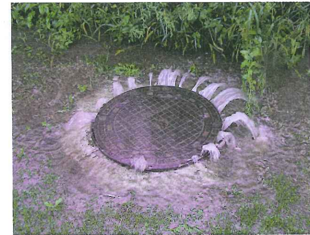
Beispiel für Überlastung der Kanalisation