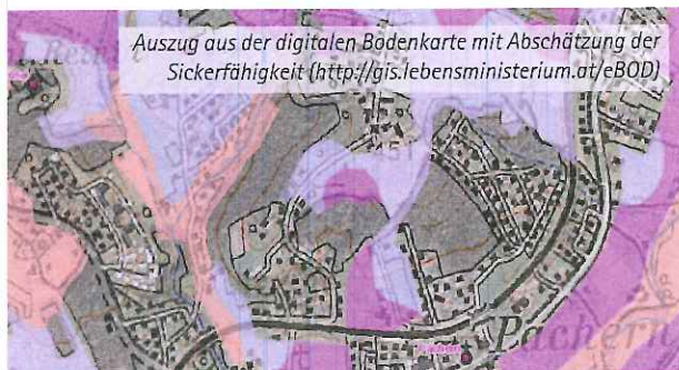
Auszug aus der digitalen Bodenkarte mit Abschätzung der Sickerfähigkeit ( http://gis.lebensministerium.at/eBOD )

Der Leitfaden steht im Internet unter folgenden Adressen als Download zur Verfügung: www.wasserwirtschaft.steiermark.at www.raumplanung.steiermark.at www.umwelt.steiermark.at