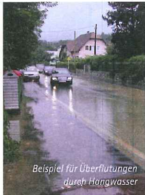
Beispiel für Überflutungen durch Hangwasser

Die gesetzeskonforme sowie fachgerechte Verbringung von Oberflächenwässern und die damit erforderliche Beurteilung im konkreten Bauverfahren gewinnt auch wegen des zunehmenden Bebauungs- und Versiegelungsgrades immer mehr an Bedeutung.