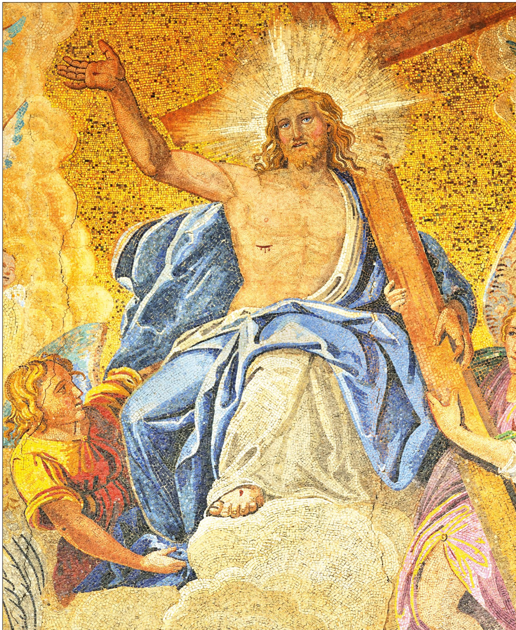
Lattanzio Querena: Das Jüngste Gericht (Markusdom, Venedig)